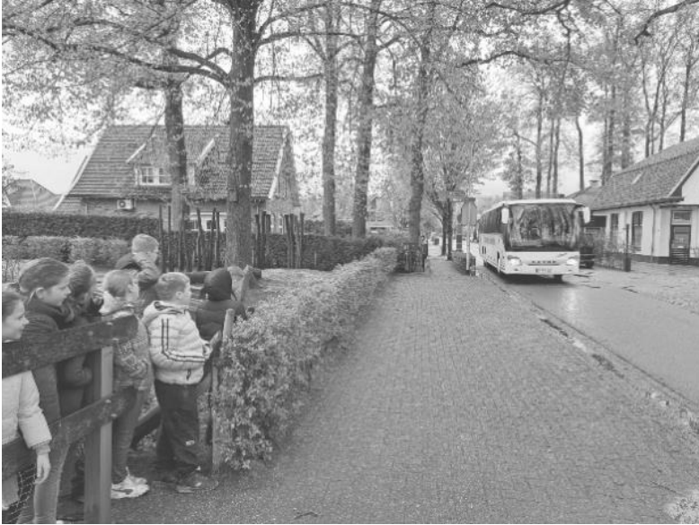
Uitwisseling met Rheine

Nu het weer steeds beter wordt gaan we steeds vaker picknicken en buiten les gegeven. Wie weet komt u ons wel eens tegen. Natuurlijk zitten de kinderen ook met de neus in de boeken. Rekenen, taal, lezen en spelling komen dagelijks aan bod in de midden- en bovenbouw. Groep 1/2 werkt op dit moment aan een project over machines en bewegen. Zij hebben hun eigen Bauhaus gemaakt. Ook fietsen maken is inmiddels geen probleem voor ze.